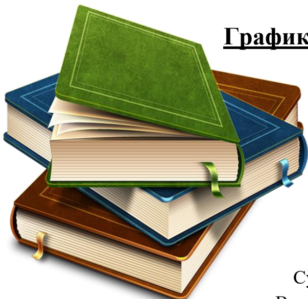
График работы учреждения:

МУК «Межпоселенческая центральная библиотека»